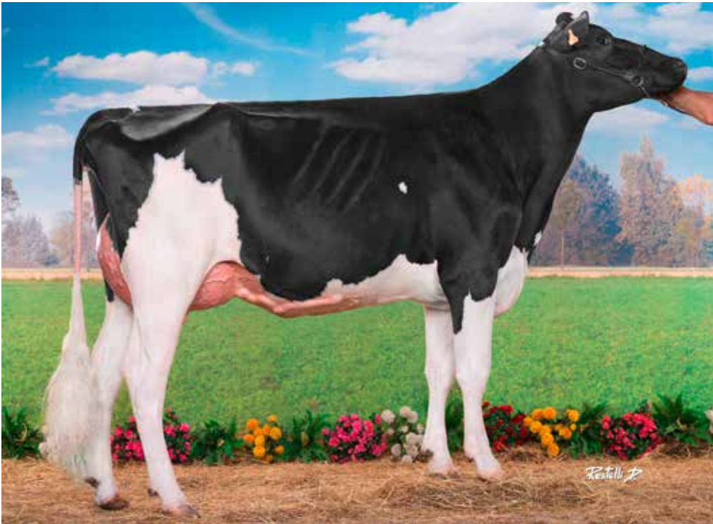
hija de ISITOLLO